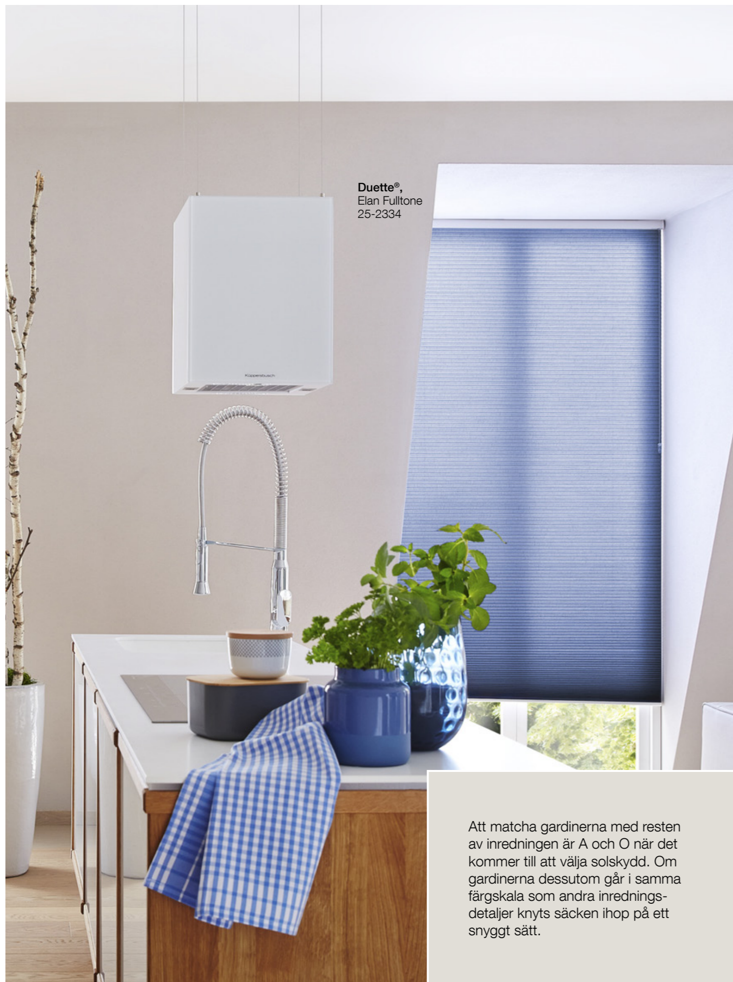
Duette®, Elan Fulltone 25-2334

Att matcha gardinerna med resten av inredningen är A och O när det kommer till att välja solskydd. Om gardinerna dessutom går i samma färgskala som andra inredningsdetaljer knyts saken ihop på ett snyggt sätt.