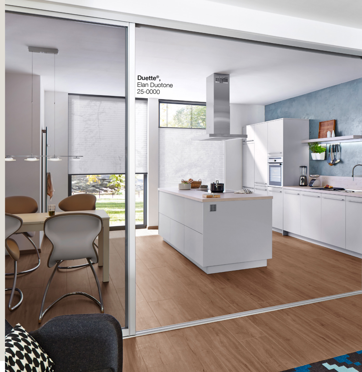
Duette®, Elan Duotone 25-0000

Att matcha gardinerna med resten av inredningen är A och O när det kommer till att välja solskydd. Om gardinerna dessutom går i samma färgskala som andra inredningsdetaljer knyts saken ihop på ett snyggt sätt.