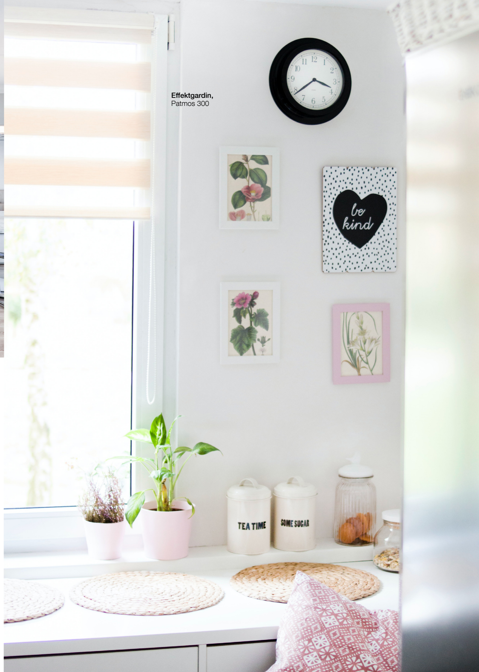
Effektgardin, Patmos 300