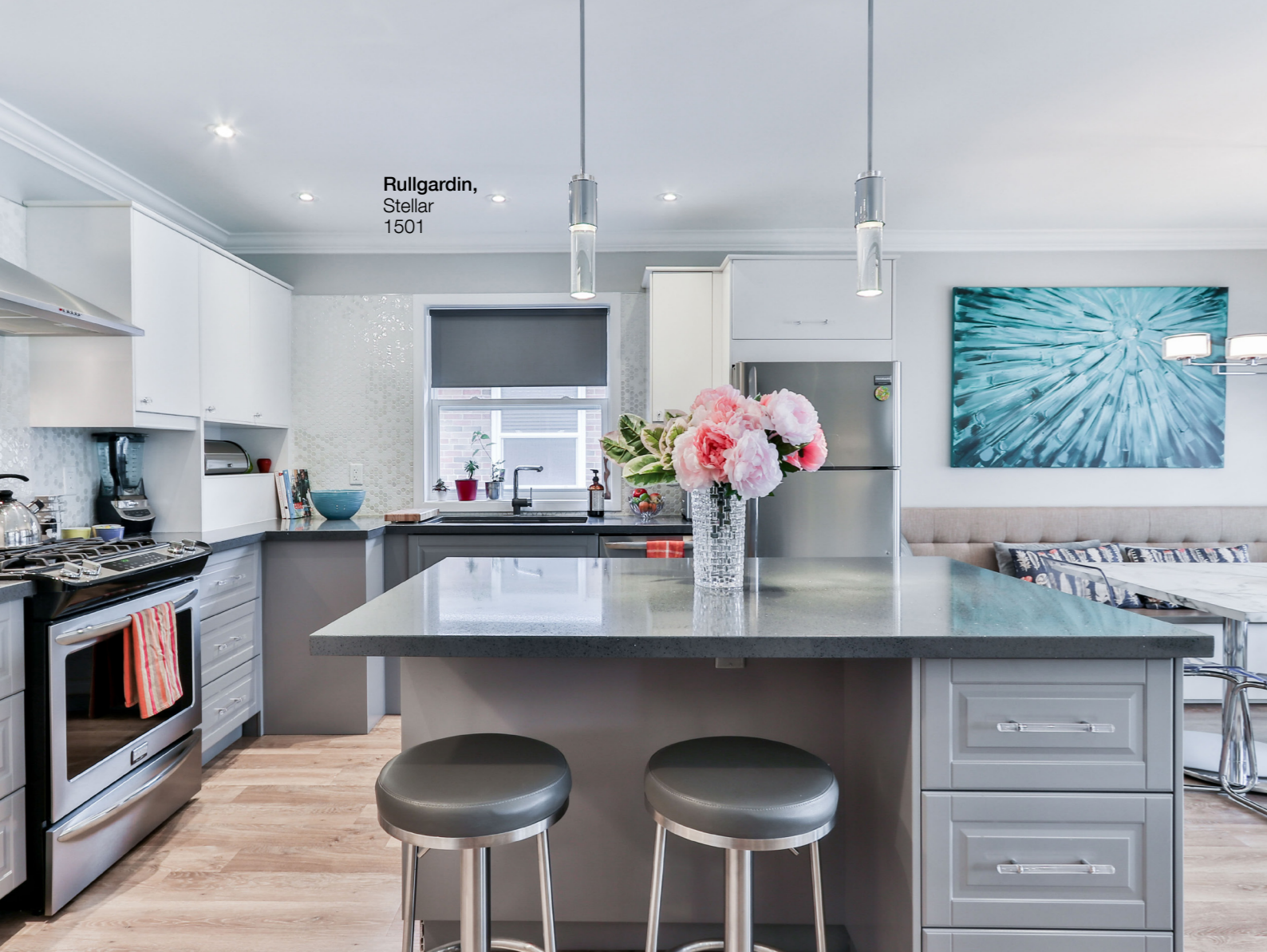
Rullgardin, Stellar 1501