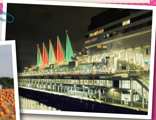
菅野 淑恵 様