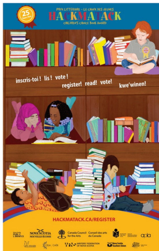
Poster illustration by artist Kawama Kasutu Illustration de l'affiche par artiste Kawama Kasutu

Reading clubs from schools and libraries — 84 in all — registered to participate in the 2023-24 program. Our student readers hailed from all corners of Atlantic Canada: from River Hebert to Canso in Nova Scotia, Back Bay to Shippigan in New Brunswick, and from Charlottetown, Prince Edward Island to North River, Newfoundland, and a returning club from Montreal that first joined us in 2022-23.