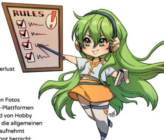
Grafik von Megan Uosiu

Alle Cosplayer bzw. Privatpersonen der Messe können Fotos und Videos machen und diese auch auf den Cosplay-Plattformen hochladen, so lange die Fotos privater Natur sind und von Hobby Fotografen gemacht werden. Bitte achtet jedoch auf die allgemeinen gesetzlichen Regelungen. Fragt bevor ihr jemanden aufnehmt immer erst um Erlaubnis! Generelles Foto- & Filmverbot herrscht wenn der Moderator vor einem Programmpunkt dies erwähnt.