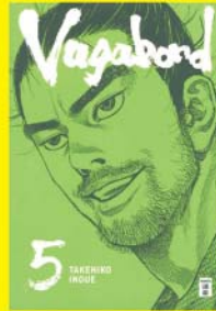
Vagabond Master 1-5