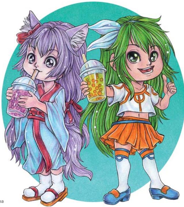
Grafik von Zadzeana