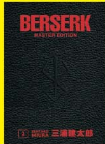
Berserk Master 1-2