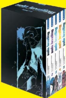
Solo Leveling Schuber 1-2