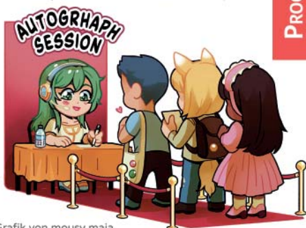
Grafik von mousy maja