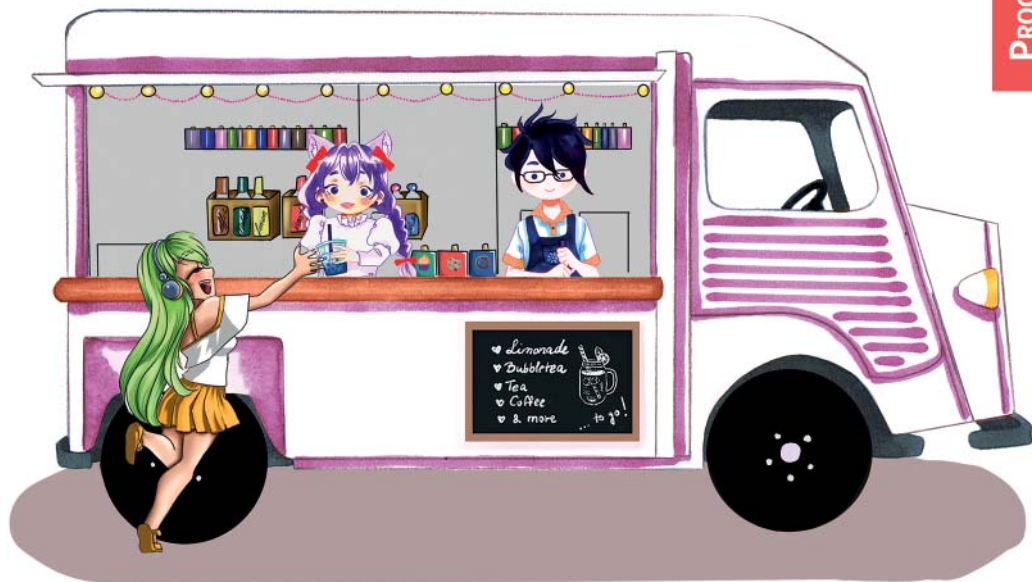
Grafik von Ari-chan Art

F01 todoki F02 Mangaküche F03 Kawaii Neko - Dein Nerdstore F04 Otaku Vault