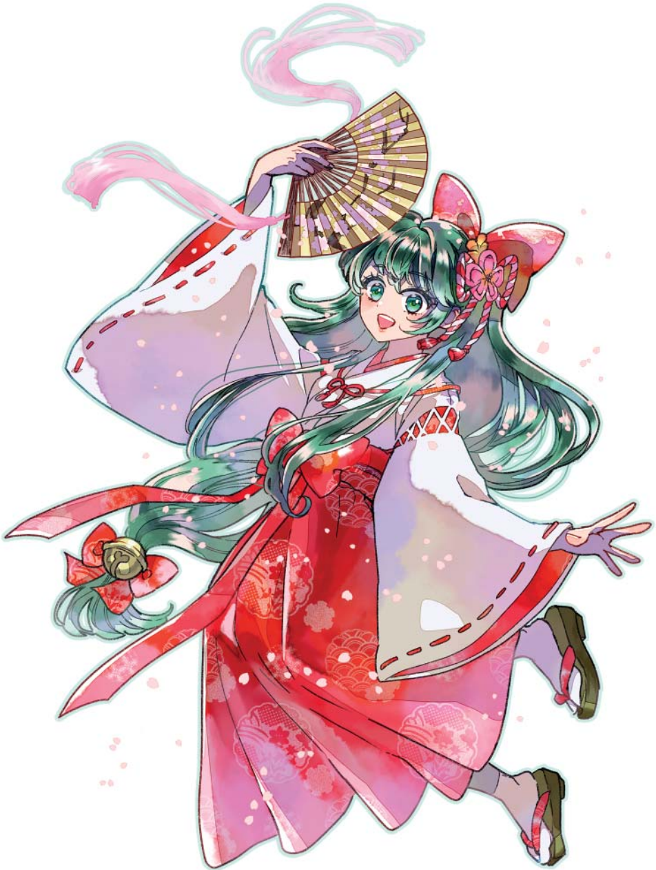
Grafik von Bonmaru