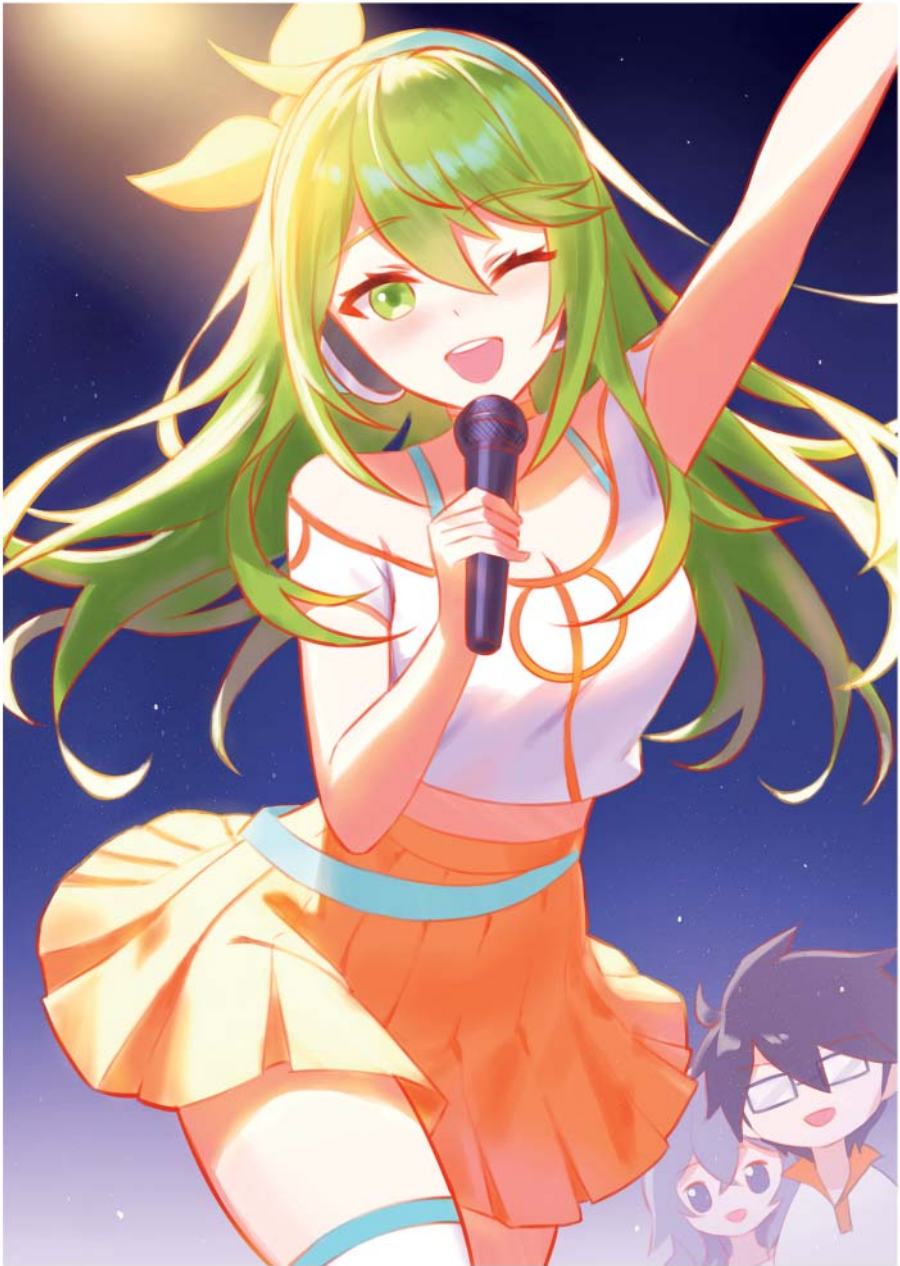
Grafik von Acaiart