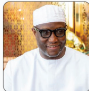
M. Mouhamadou Makhtar CISSE Ministre de l'Intérieur et de la Sécurité publique