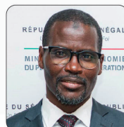
M. Allé Nar DIOP Ministre auprès du Ministre de l'Economie, des Finances et du Plan, chargé de l'Economie, du Plan et de la Coopération