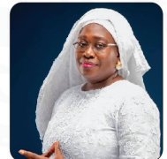
Mme Marie Angélique Mame Selbé DIOUF Ministre de la Famille, de l'Action sociale et des Solidarités