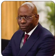
M. Boubacar CAMARA Ministre de l'Enseignement supérieur, de la Recherche et de l'Innovation