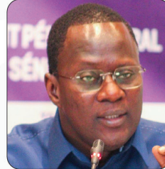
M. Papa Assane TOURE Ministre Secrétaire général du Gouvernement