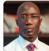
M. Moussa SARR Ministre de la Justice, Garde des Sceaux