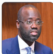
M. Bassirou SARR Ministre auprès du Ministre de l'Economie, des Finances et du Plan, chargé du Budget