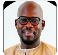
M. Samba DIOUF Ministre des Télécommunications et du Numérique