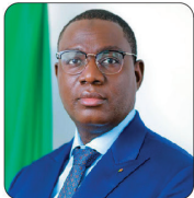
M. Moussa Bala FOFANA Ministre de l'Urbanisme, des Collectivités Territoriales et de l'Aménagement des Territoires