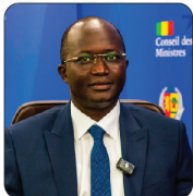
M. Yankoba DIEME Ministre des Forces Armées