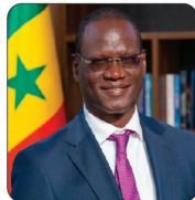
M. El Hadji Abdourahmane DIOUF Ministre de l'Energie et du Pétrole