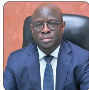
M. Cheikh DIBA Ministre de l'Economie, des Finances et du Plan