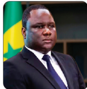
M. Déthié FALL Ministre des Infrastructures