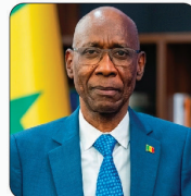
M. Cheikh NIANG Ministre de l'Intégration Africaine, des Affaires étrangères et des Sénégalais de l'Extérieur