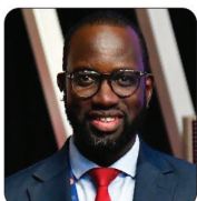
M. Abdoul Ahad NDIAYE Ministre des Transports terrestres et aériens