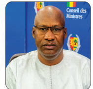
M. Ibrahima SY Ministre de la Santé et de l'Hygiène Publique