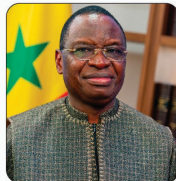
M. Serigne Guèye DIOP Ministre de l'Industrie et du Commerce