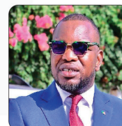
M. Ousmane DIAGNE Ministre auprès du Ministre de l'Agriculture, de la Souveraineté alimentaire et de l'Elevage, chargé de l'Elevage