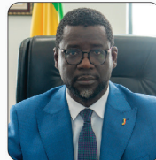
M. Alioune DIONE Ministre de la Microfinance et de l'Economie Sociale et Solidaire