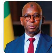
M. Moustapha Mamba GUIRASSY Ministre de l'Education Nationale