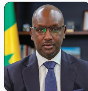
M. Cheikh Tidiane DIEYE Ministre de l'Hydraulique et de l'Assainissement